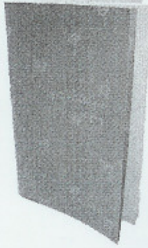
Text & foto Lasse Gradin

– Jag har aldrig känt mig som barn. Det var alltid något med mina syskon, mycket oro och det var hela tiden något strul med myndigheter. Det gick åt så mycket tid och energi till mina syskon att det inte fanns tid eller plats för mig, berättar Frida Blomgren.